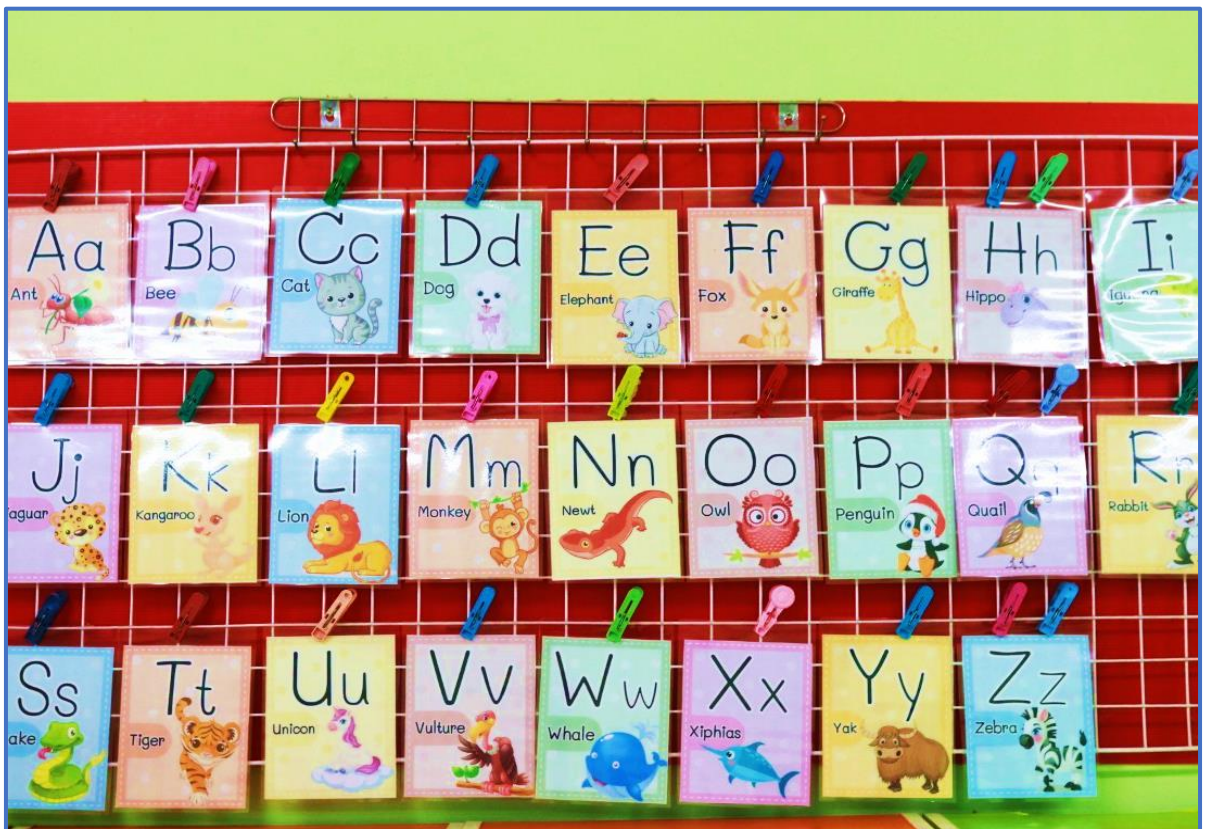
สื่อการเรียนการสอน