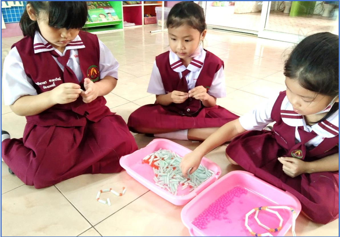
เรียนรู้และสร้างองค์ความรู้ด้วยตนเอง