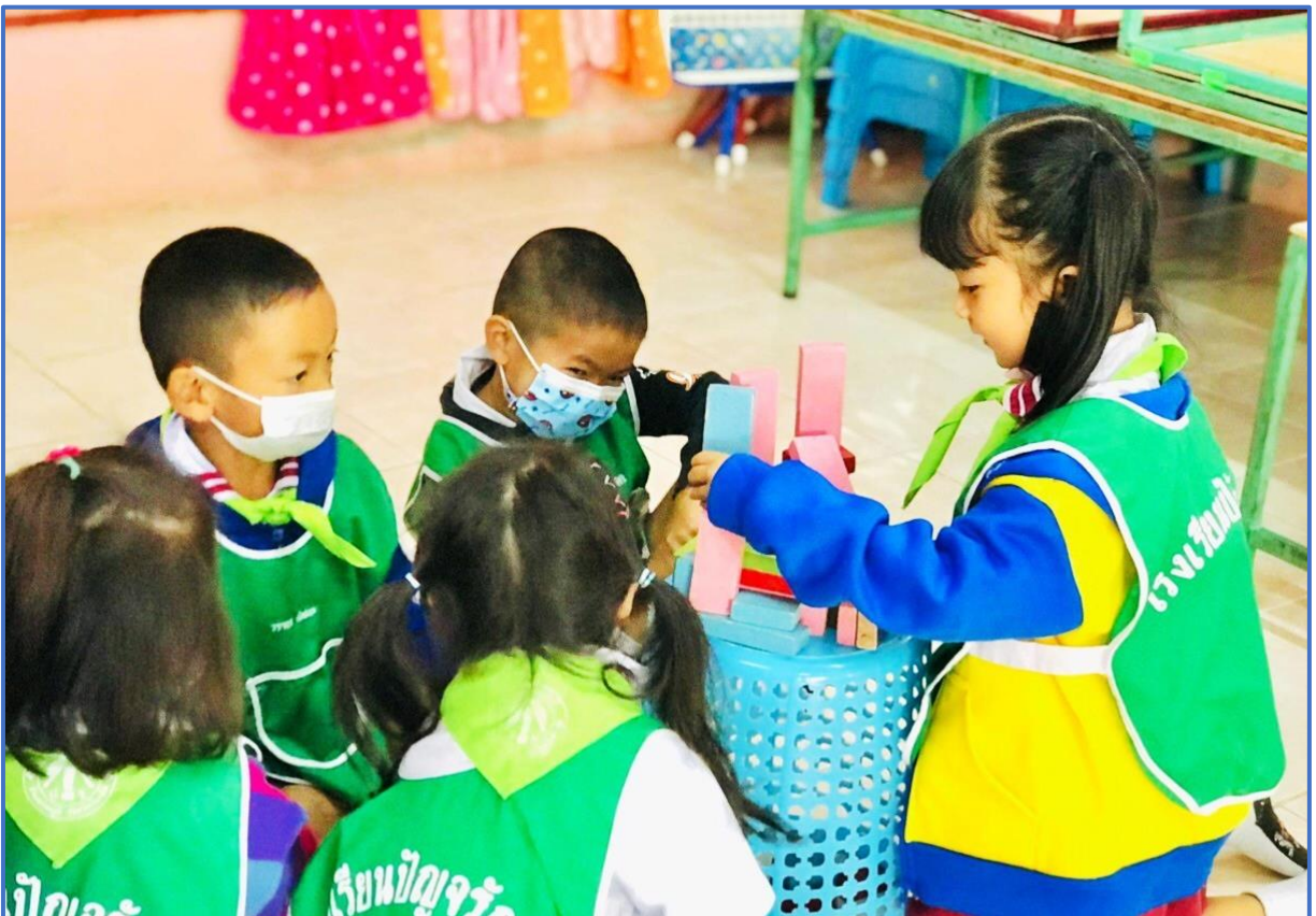
กิจกรรมส่งเสริมพัฒนาการด้านสังคม