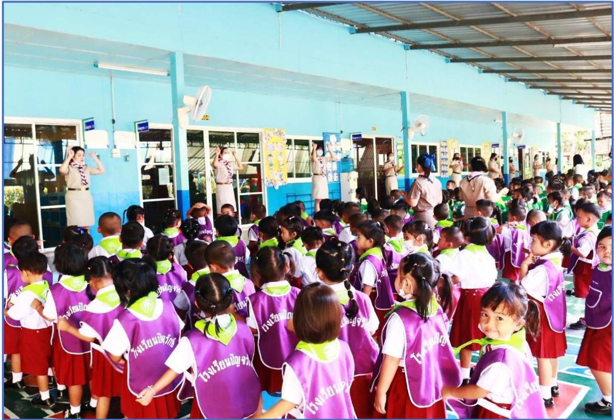
กิจกรรมส่งเสริมพัฒนาการด้านอารมณ์-จิตใจ