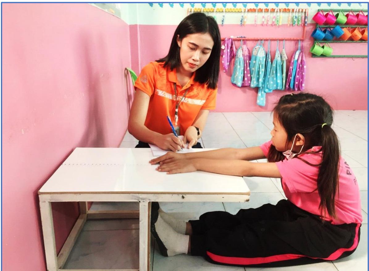
นำผลการประเมินไปพัฒนาคุณภาพเด็กอยู่เสมอ