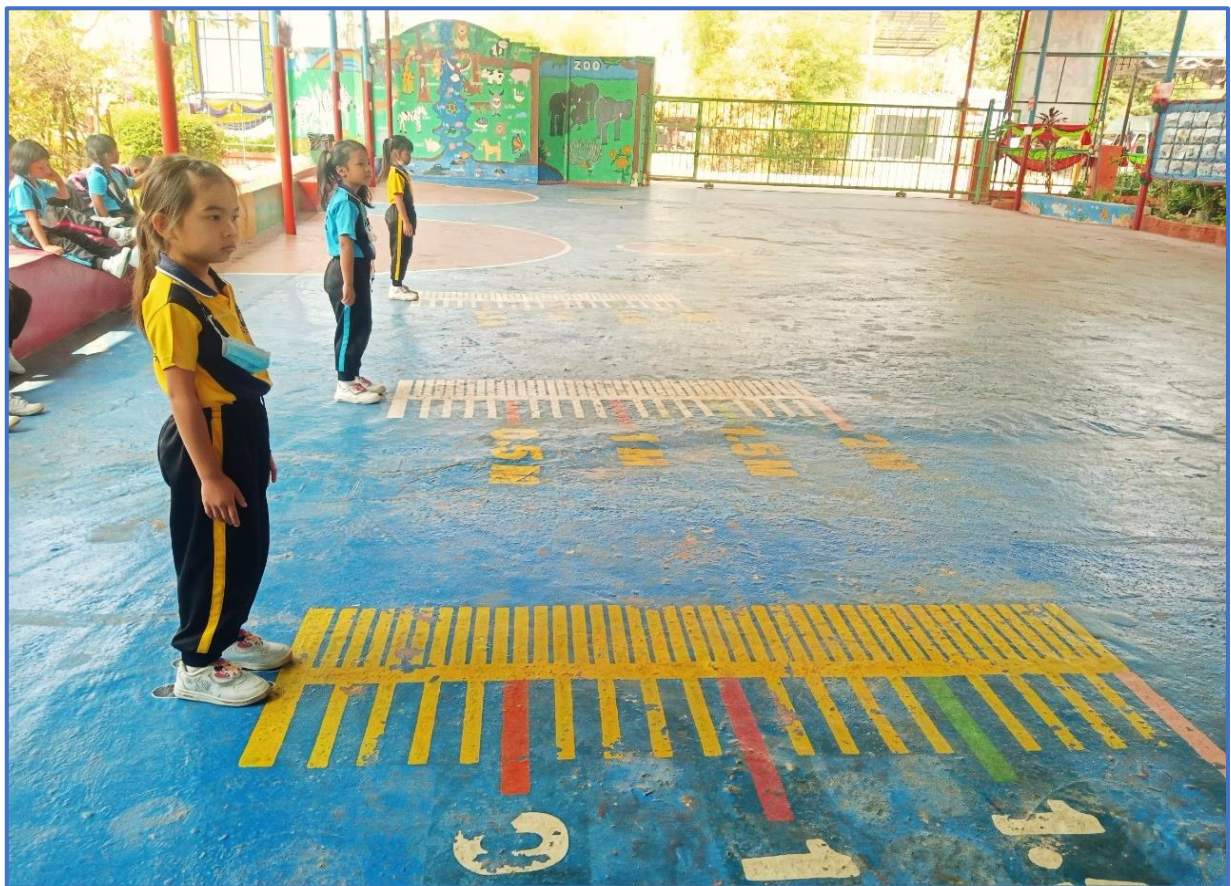
กิจกรรมส่งเสริมพัฒนาการด้านร่างกาย