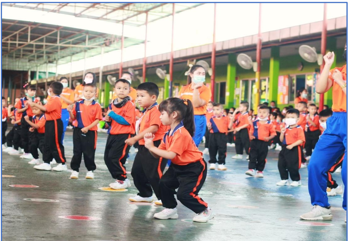
กิจกรรมส่งเสริมพัฒนาการด้านอารมณ์-จิตใจ