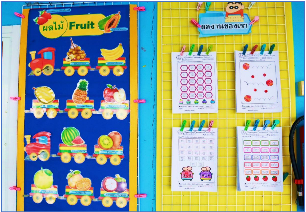
ผลงานนักเรียน