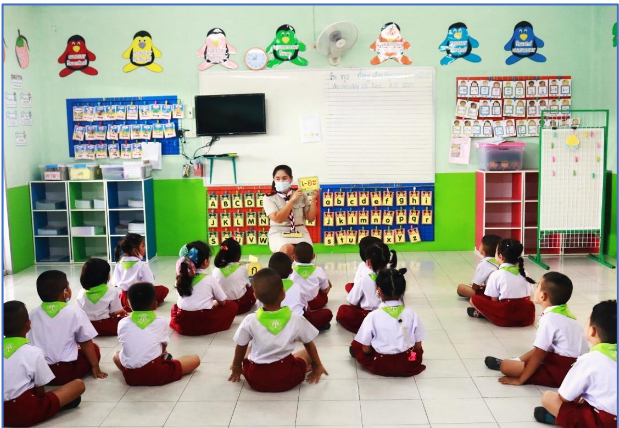
กิจกรรมส่งเสริมพัฒนาการด้านสติปัญญา