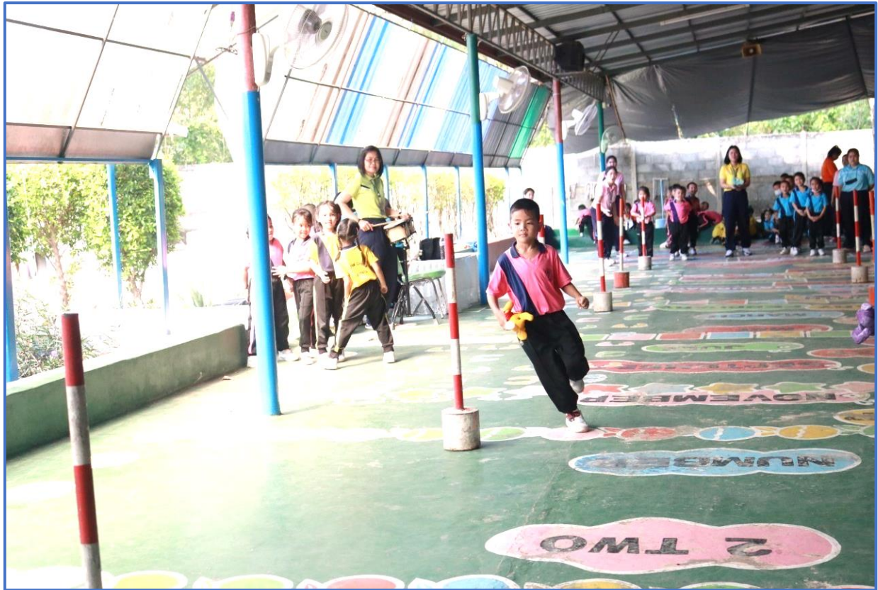
กิจกรรมส่งเสริมพัฒนาการด้านร่างกาย