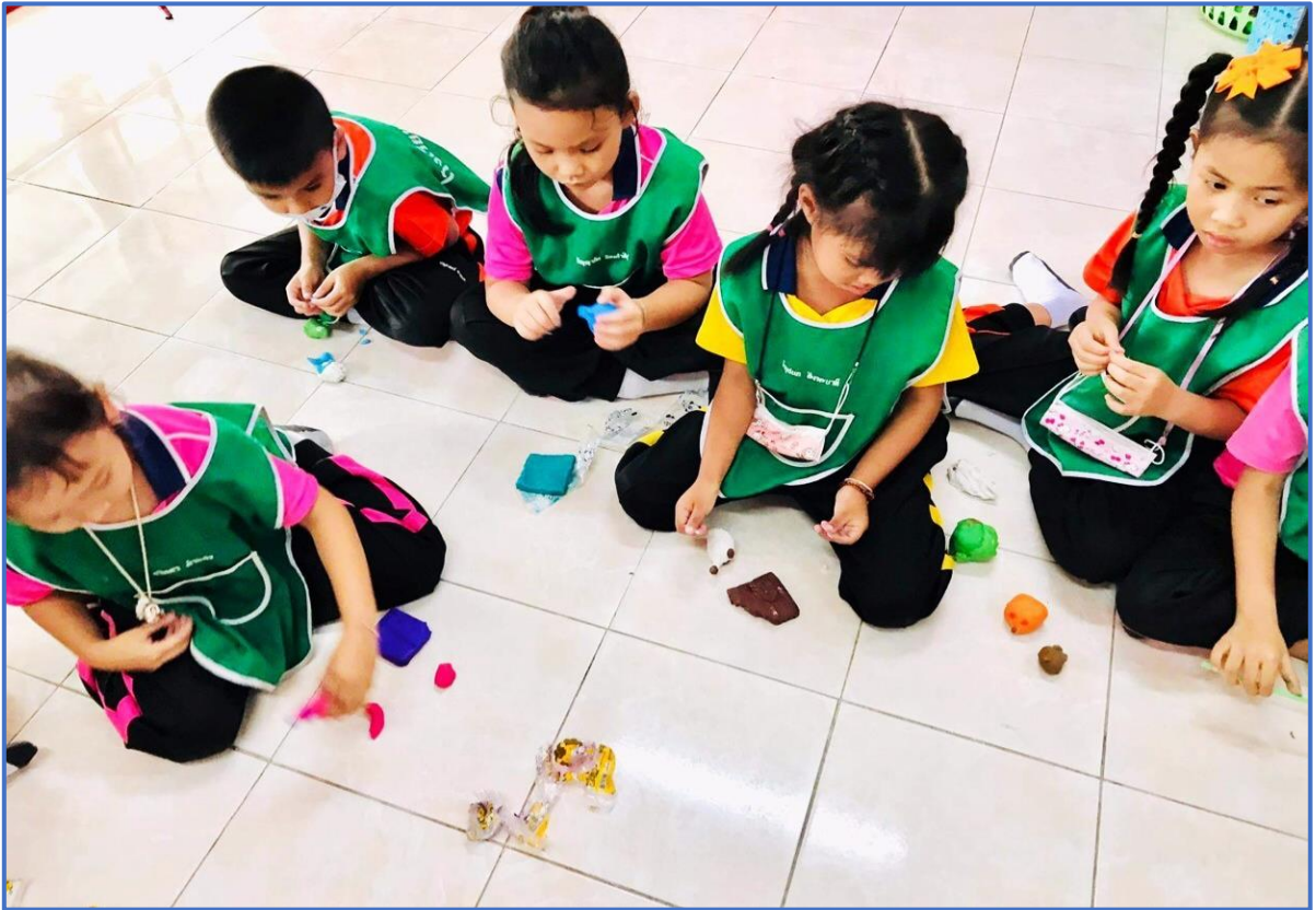
เลือกทำกิจกรรมอย่างอิสระ