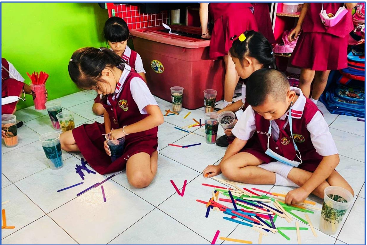
เลือกทำกิจกรรมตามความสนใจของตนเอง