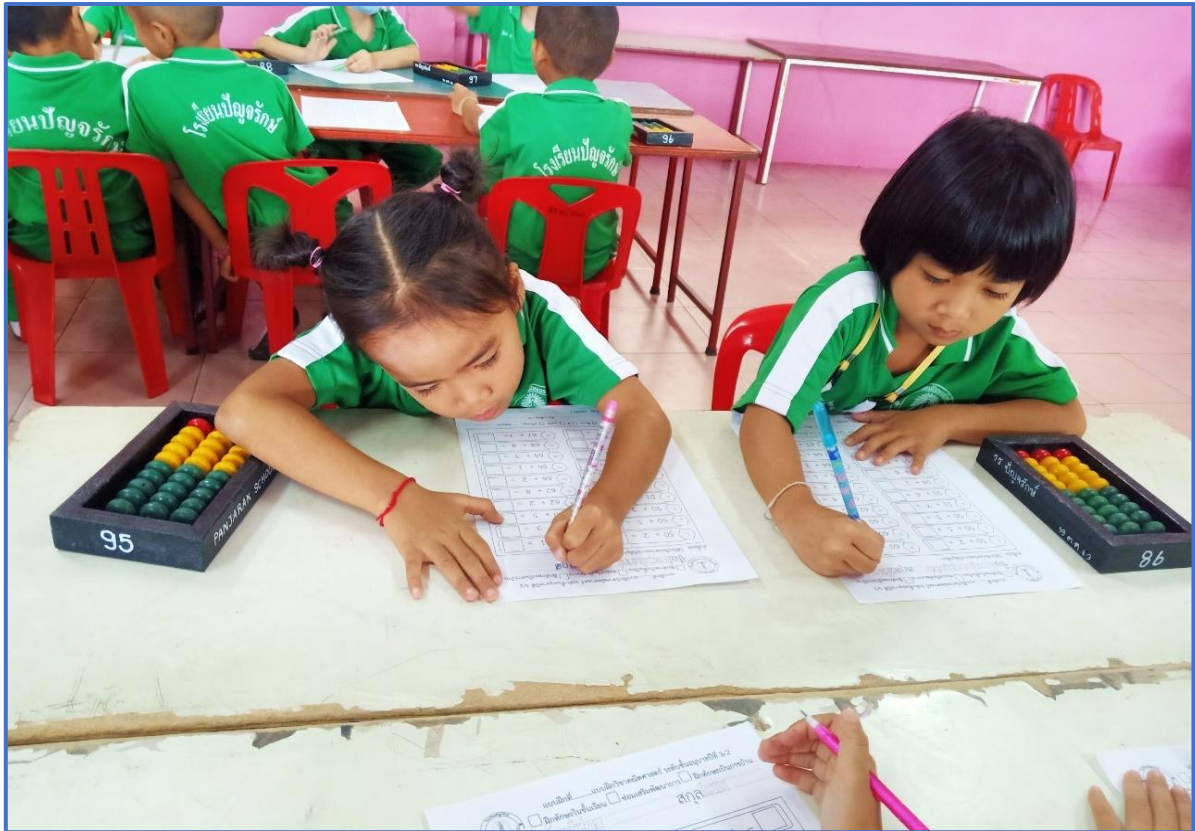
การคิดและหาคำตอบโดยการใช้สื่อนวัตกรรมใหม่ๆ