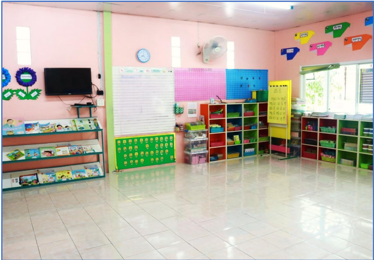
สภาพแวดล้อมในชั้นเรียน