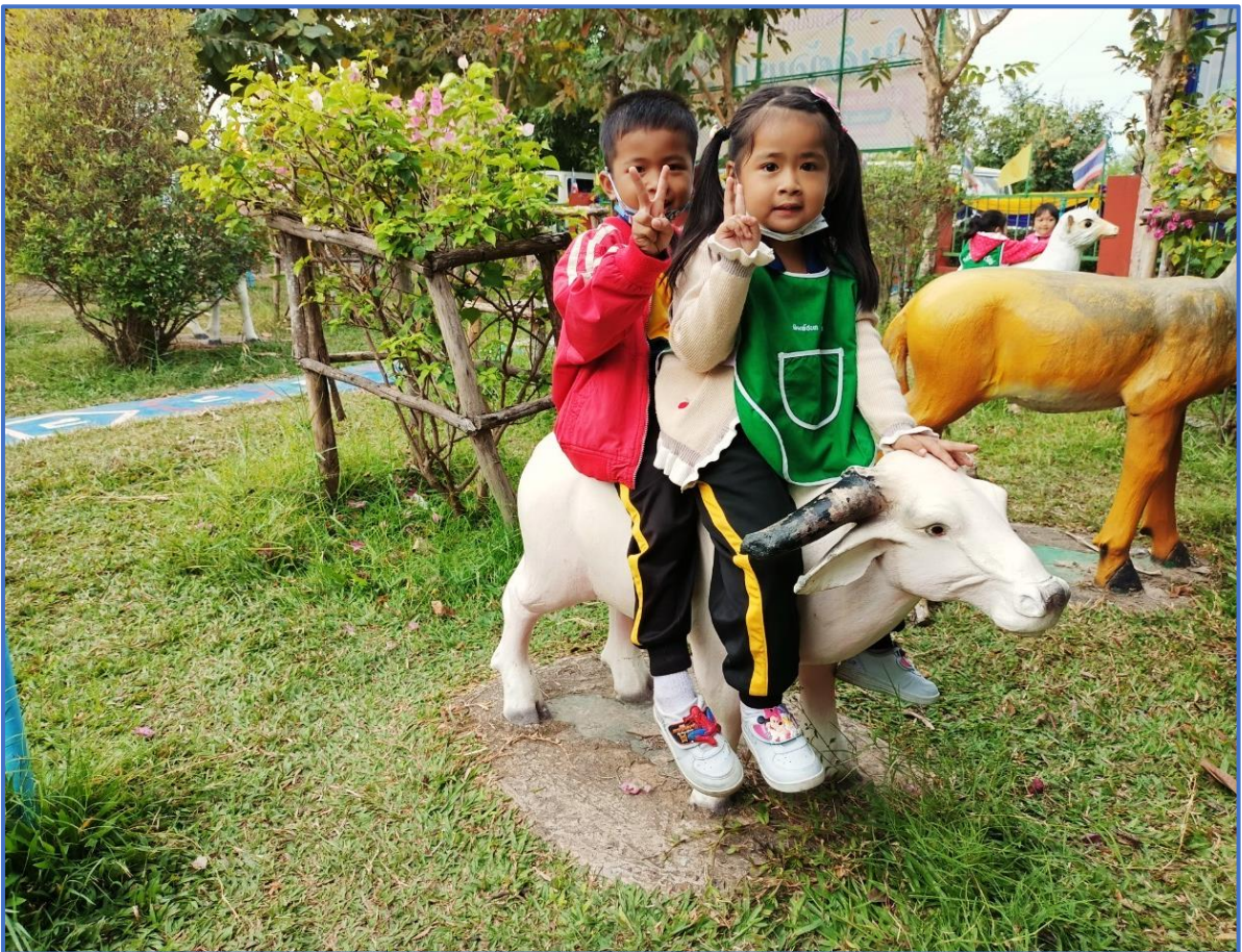
เลือกทำกิจกรรมตามความสนใจด้วยตนเอง