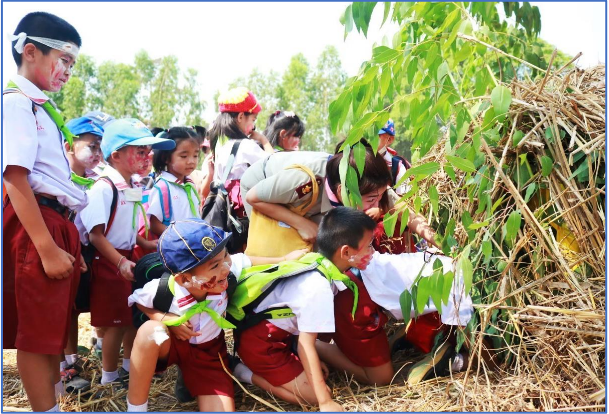
กิจกรรมส่งเสริมพัฒนาการด้านสังคม