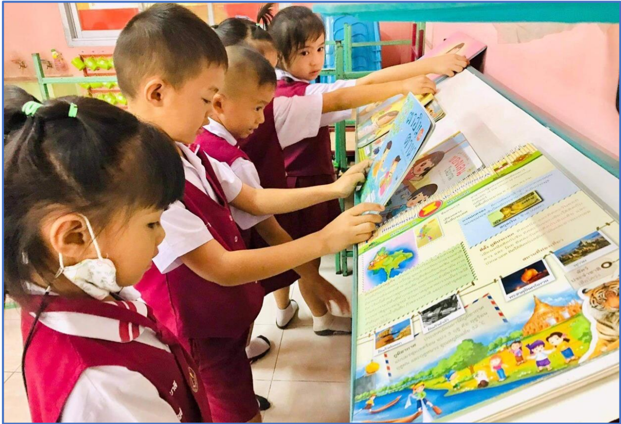
กิจกรรมส่งเสริมพัฒนาการด้านสติปัญญา